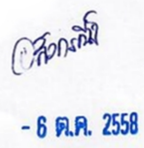
(นางไกรสรจันทร์ ລາຍເມຊ) หัวหน้าฝ่ายบริหารงานทั่วไป

จึงเรียนมาเพื่อโปรดทราบและพิจารณาดำเนินการในส่วนที่เกี่ยวข้องต่อไป