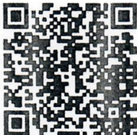
QR Code ส่งใบสมัคร

หมายเหตุ ๑. กรอกใบสมัครส่งมาทาง Line โดยสแกน QR code หรือ E-mail : unisearch.rmuti@gmail.com ๒. กรุณาเขียน/พิมพ์ ตัวบรรจงเพื่อการออกใบเสร็จและใบประกาศนียบัตร ๓. สอบถามข้อมูลเพิ่มเติมได้ที่เบอร์โทรศัพท์หมายเลข ๐๘๐-๐๕๖๗๙๙๐ (เรื่องของจำนวนผู้เข้ารับการ สัมมนาก่อนการจองตัวเครื่องบิน/โรงแรมที่พัก)